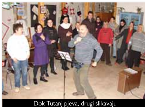
Dok Tutanj pjeva, drugi slikavaju

ova metoda nema samo pozitivan umjetnički, već i utjecaj pozitivan za zdravlje. Na tečaju je sudjelovalo i nekoliko članova Društva turističkih vodiča "Dubrovnik". Vježbe koje se rade mogu biti vrlo korisne turističkim vodičima jer nas uče kako odraditi posao bez