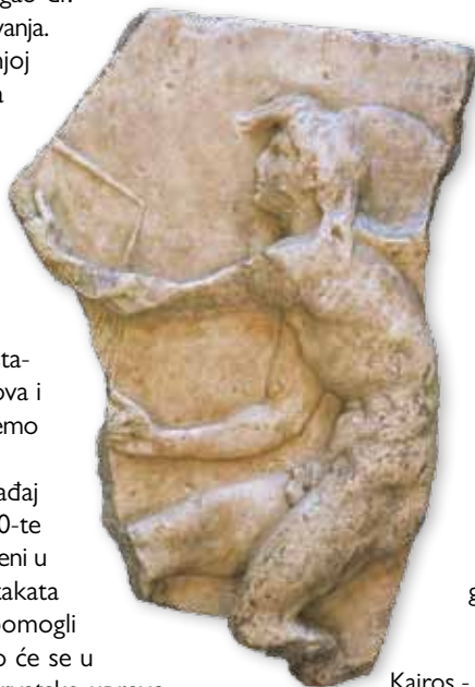
Kairos - bog sretnog trenutka